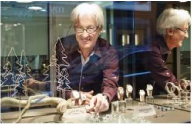
Highlight ! สวิตเซอร์แลนด์เป็นผู้ผลิตนาฬิกาชั้นนำของโลก ใช้มาตรฐานการผลิตเข้มงวด วัสดุคุณภาพสูงสุด ผ่านการทดสอบอย่างละเอียด หากคุณกำลังมองหา นาฬิกา ที่สวิสเป็นตัวเลือกที่สมบูรณ์แบบ 👍

เช้า ๑๑ รับประทานอาหารเช้า ณ โรงแรม (เมื่อที่8) จากนั้นนำท่านเที่ยวชม เมืองซุก (ZUG) ประเทศ สวิตเซอร์แลนด์ (ระยะทาง 265 กม. / 3.30 ชม.) เป็นเมืองที่ร่ำรวยที่สุดในประเทศ และยังเป็นเมืองที่ติดอันดับหนึ่งในสิบของโลกเมืองที่สะอาดที่สุด อิสระช้อป ที่ Lohri AG Store ที่มีนาฬิกาชั้นนำระดับโลกให้ท่านเลือกซื้อเลือกชม อาทิ เช่น Patek Philippe, Franck Muller Cartier , Piaget, Parmigiani Fleurier, Panerai, IWC , Omega, Jaeger-LeCoultre, Blancpain, Tag Heuer ฯลฯ