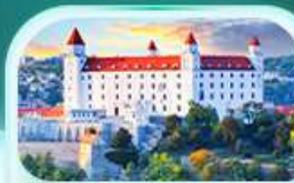
ปราสาทบราติสลาวา

เที่ยวชมเมืองอัลส์ดัทท์ หมู่บ้านริบะเลสาบสวยที่สุดในโลก พระราชวังเซินบรุนน์ เมืองลินซ์ จิตรกรรมฝาผนังยักษ์ สัมผัสเมืองมรดกโลก เซสกี ครุสโลฟ เยี่ยมชมปราสาทปราก ถนนทองคำ เช็กอินสถานที่ชื่อดัง! ปราสาทบราติสลาวา ล่องเรือชมความงามแม่น้ำดานูบ แม่น้ำที่ยาวที่สุดในยุโรป ชมความน่าหลงใหลของ ปราสาทบูคาเปสต์ สะพานชาร์ลส์