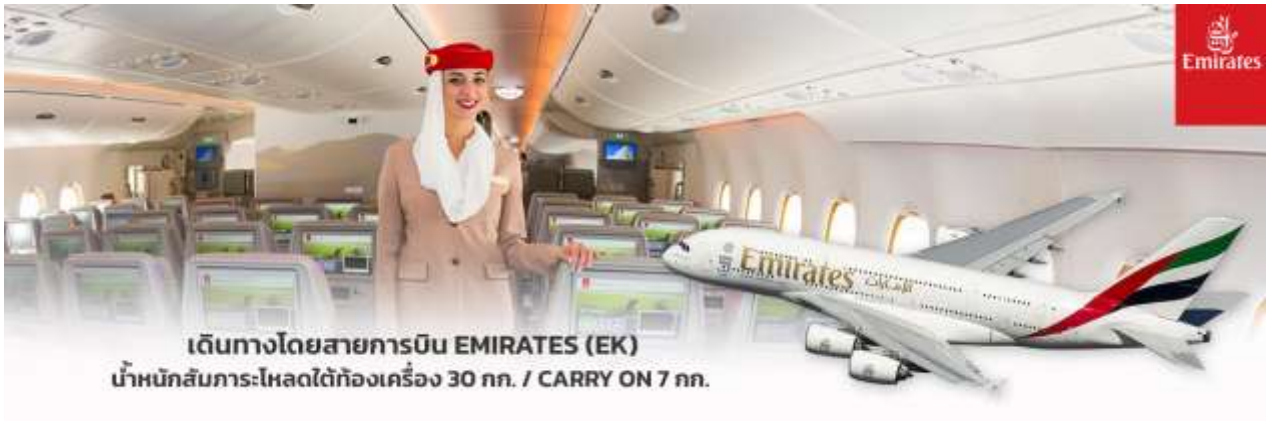
เดินทางโดยสายการบิน EMIRATES (EK) น้ำหนักสัมภาระ:โหลดใต้ท้องเครื่อง 30 กก. / CARRY ON 7 กก.