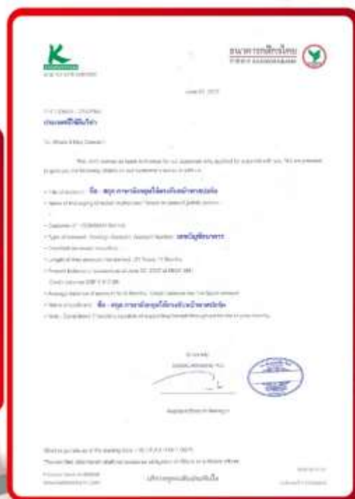
ตัวอย่าง Bank Guarantee ที่ผู้สมัครต้องยื่นขอธนาคาร