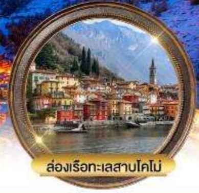
ล่องเรือทะเลสาบโคโม