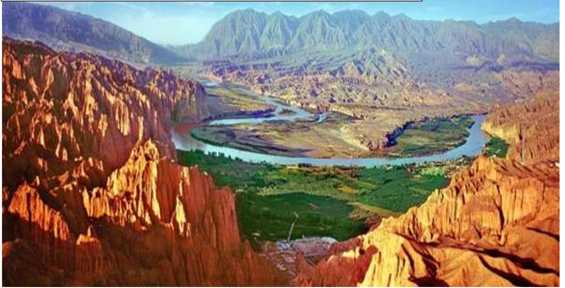
The Yellow River Stone Forest scenic area [Photo provided to China Daily] https://www.chinadaily.com.cn/m/gansu/baiyin/2013-12/14/content_17154135.htm