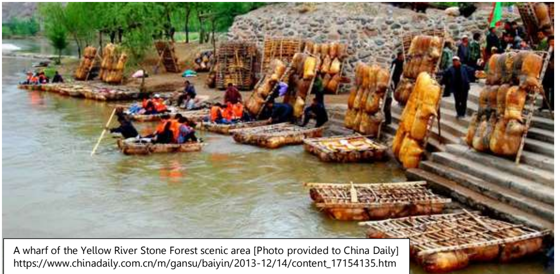
A wharf of the Yellow River Stone Forest scenic area [Photo provided to China Daily] https://www.chinadaily.com.cn/m/gansu/baiyin/2013-12/14/content_17154135.htm