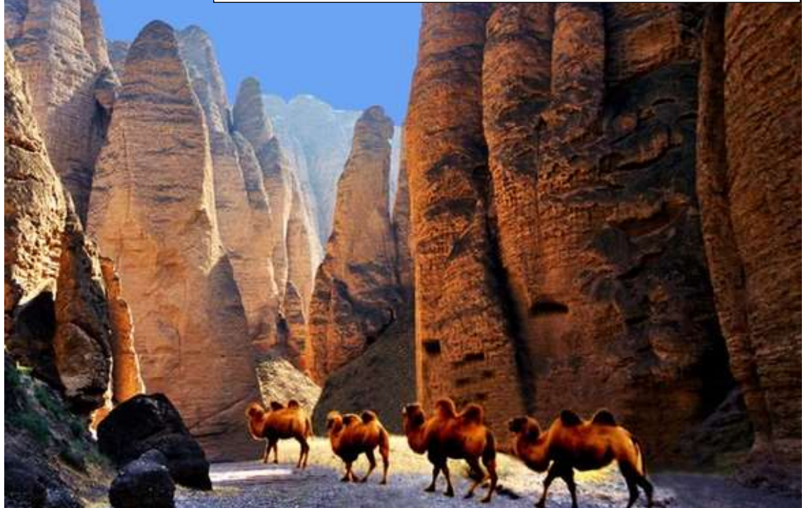
The Yellow River Stone Forest scenic area [Photo provided to China Daily] https://www.chinadaily.com.cn/m/gansu/baiyin/2013-12/14/content_17154135.htm