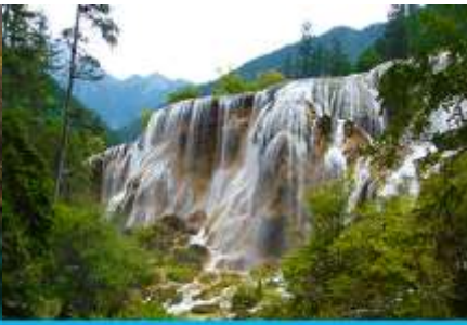
น้ำตกธารไข่มุก