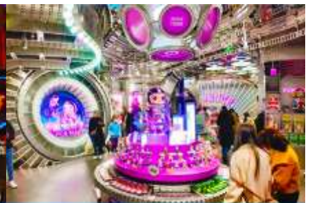
ร้าน POP MART

วันที่ห้า จิวจ้ายโกว-เงินเจียงกวน-ขึ้นรถไฟความเร็วสูง-นครเฉิงตู-ช้อปปิ้งถนนชุนชิวร้าน POP MART