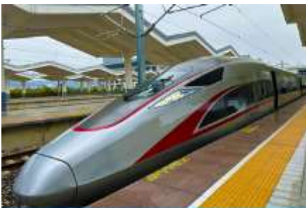
เมืองรถไฟความเร็วสูง

พักที่ XINGYU INTERNATIONAL หรือ โรงแรมระดับ 4 ดาวท้องถิ่น