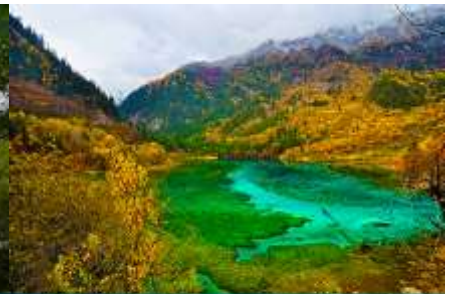
ทะเลสาบนกยูง (PEACOCK LAKE)

นำท่านชม ทะเลสาบแรด (RHINO LAKE) สูงจากระดับน้ำทะเล 2,301 เมตร น้ำลึกโดยเฉลี่ย 17 เมตร ยาวราว 2 กิโลเมตร เป็นทะเลสาบขนาดใหญ่ เส้นน้ำประพบบใจของทะเลสาบนี้คือ หมอกเมฆและสายหมอกที่สะท้อนทะเลสาบแรดจนแยกไม่ออกว่าส่วนไหนที่เป็นท้องฟ้า ความเปลี่ยนแปลงของทั้งเมฆและหมอกในทุกๆ ชั่วโมงให้ความงดงามที่แตกต่างกันไปในแต่ละวันอย่างน่าประทับใจ นอกจากนี้ทะเลสาบแรดเป็นทะเลสาบเดียวที่อนุญาตให้นักท่องเที่ยวล่องเรือยอซต์ได้