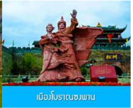
เมืองโบราณซงพาน

วันที่สาม อุทยานภูเขาสี่ดรุณี-ผ่านชมวิวกูเขาที่ราบสูง-ทะเลสาบเต๋อซี- เมืองโบราณซงพาน-เมืองชวนจู่ซื่อ