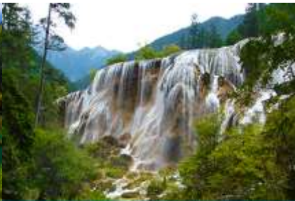
น้ำตกธารไข่มุก