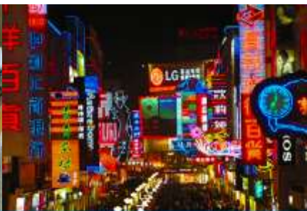
ถนนคนเดินซุนชิว