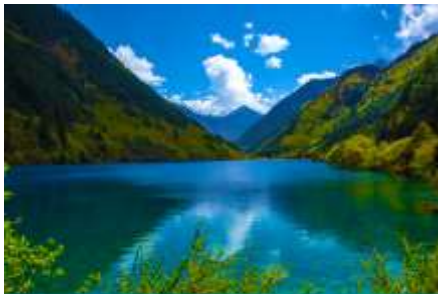
ทะเลสาบแรด (RHINO LAKE)

หลังอาหารเช้านำท่านเดินทางสู่ อุทยานแห่งชาติจิวจี้โกว (JIUZHAIGOU NATIONAL PARK) ตั้งอยู่ด้านทิศเหนือของมณฑลเสฉวน ซึ่งเป็นส่วนหนึ่งในบริเวณตอนใต้ของเทือกเขาหิมชาน ห่างออกไปจากตัวเมืองเจียงตูราว 500 กิโลเมตร จิวจี้โกวมีชื่อเสียงด้านความงามแห่งสถานที่ที่แปลกเปลี่ยนไม่รู้จบ ทะเลสาบผุดขึ้นท่ามกลางหมอกเมฆไม้เขียวขจี น้ำใสเป็นประกายชุ่มฉ่ำ ยอดเขาหิมะตัดกับท้องฟ้าสีคราม เกิดเป็นภาพธรรมชาติอันงดงามที่แปรเปลี่ยนไปตามฤดูกาลผลิ ด้วยความสวยงามจึงทำให้อุทยานแห่งชาติจิวจี้โกว ได้ถูกขึ้นทะเบียนเป็นมรดกโลกทางธรรมชาติ ในปีค.ศ. 1992