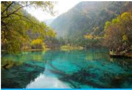
อุทยานจิวจี้โกว