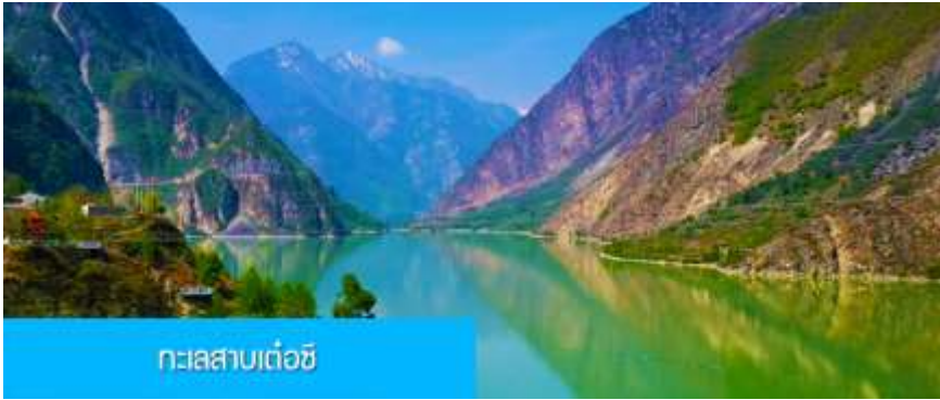
ทะเลสาบเต๋อซี