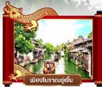
เมืองโบราณอู๋เจิน