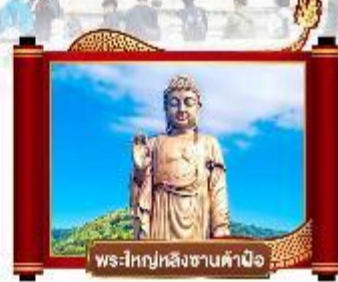
พระใหญ่หิงซานคำน้อ