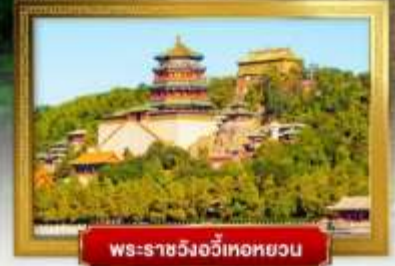
พระราชวังอวิเทอหยวน