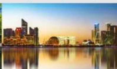
QIANJIANG NEW CITY