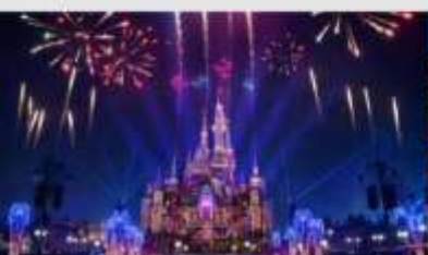
เซี่ยงไฮ้ดิสนีย์แลนด์