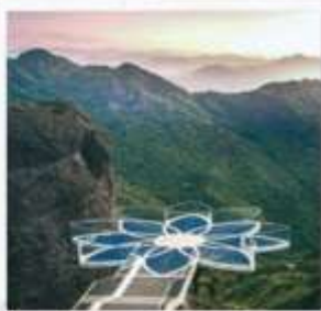
สะพานบัวสวรรค์