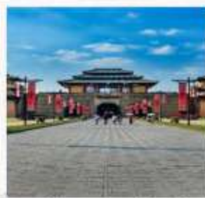
Hengdian World Studio