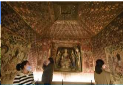
ชมภาพยนตร์ 3 มิติ