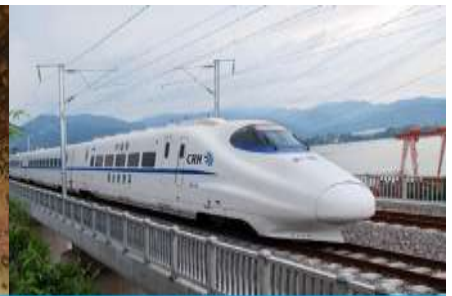
นั่งรถไฟความเร็วสูง