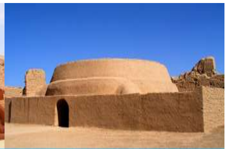
เมืองโบราณเกาซางกู่เจิง

วันที่หก ชมระบบชลประทานกู๋หลู่ฟาน – กำปั้นระพันองค์- เมืองโบราณเกาซางกู่เจิง –เดินทางสู่เมืองอูรูมูฉี