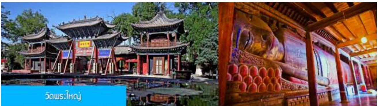
วัดพระใหญ่

พักที่ SI LU QIAN XI HOTEL โรงแรมระดับ 4 ดาวท้องถิ่น หรือเทียบเท่าในเมืองจางเยี่ยน