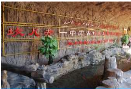
ระบบชลประทานกู๋หลู่ฟาน

พักที่ HAMPTON BY HILTON HOTEL โรงแรมระดับ 4 ดาวหรือเทียบเท่าในเมืองกู๋หลู่ฟาน