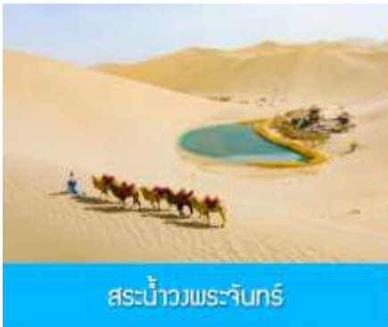
สระบัววงพระจันทร์