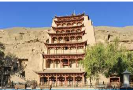
ถ้ำหินมั่วเกาถู

พักที่ METRO PARK HOTEL โรงแรมระดับ 4 ดาวหรือเทียบเท่าในเมือง둔หวง