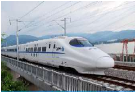
เบียร์รถไฟความเร็วสูง

พักที่ HOLIDAY INN EXPRESS HOTEL โรงแรมระดับ 4 ดาวท้องถิ่น หรือเทียบเท่าใกล้สนามบินหลันโจว