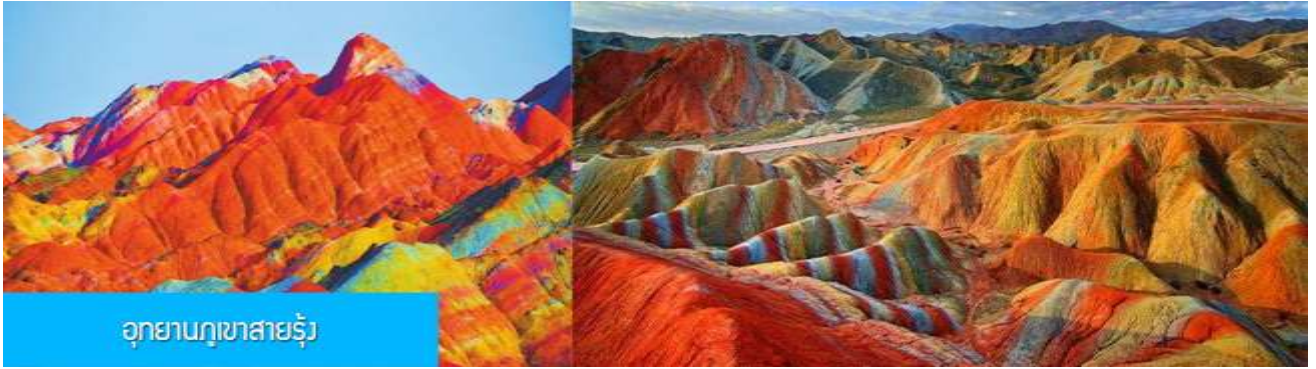
อุทยานภูเขาสายรุ้ง