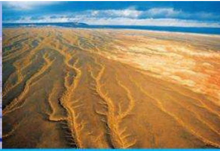
ทะเลทรายกู่เอ๋อปินทงกู่เช่อ