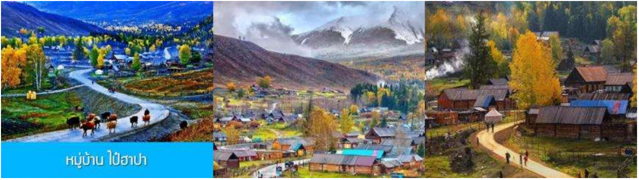
หมู่บ้าน ไปฮาปา

วันที่ห้า อุทยานคานาสีรอบที่สอง – หมู่บ้านไปฮาปา(หมู่บ้านสวยสุดในใต้หิ่ล้า) – เมืองปูเอ่อจิน