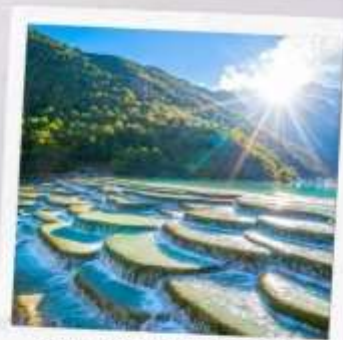
หุบเขาพระจันทร์ สีน้ำเงิน