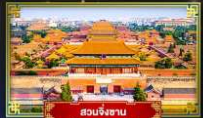
สวนจิงซาน