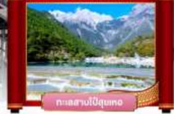
ทะเลสาบไป๋ดูยเทอ