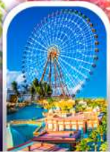
เมืองเฟนตาซี