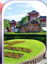
อุทยานหนานซาน

ทางเดินริมชายทะเลซานย่า - ทุ่งดอกกุหลาบอ่าวย่าหลง อุทยานหนานซาน - เทียบบนเกาะดอกไม้ - ทุ่งเกลือพินปี ช้อปปิ้งในท่ามาร์ทเกิตถนนโบราณฉีไหว