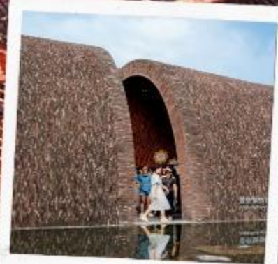
จิ่งเต๋อเจิ้น