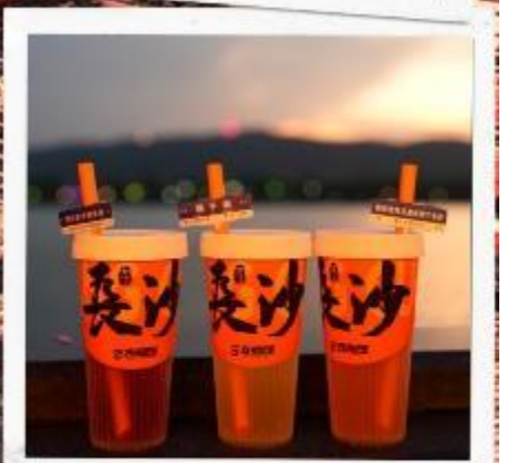
เซียงเจียงริเวอร์ไซด์