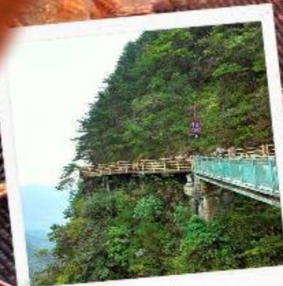
หมิงเยวี่ยซาน