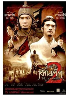
ภาพยนตร์และซีรีส์ชื่อดัง ถ่ายทำที่ Hengdian World Studios