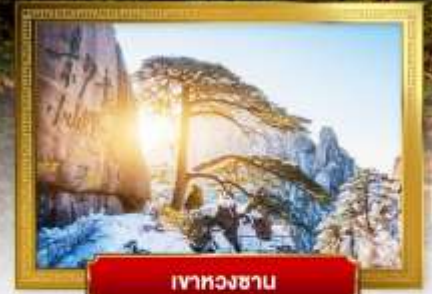
เขาหวงซาน