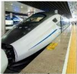
รถไฟความเร็วสูง สู่จิวจ้ายโกว