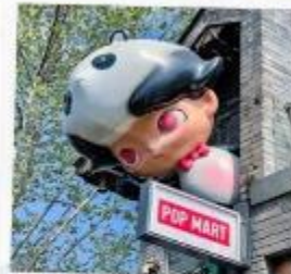
ชอยกวางแดบ