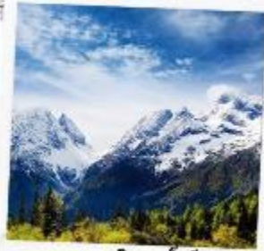
ภูเขาหิมะการ์เซีย ตำกู่ปิงชวง