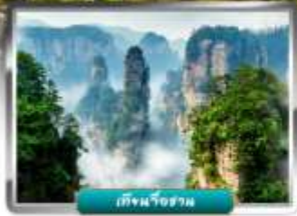
เทียนจื่อชาน