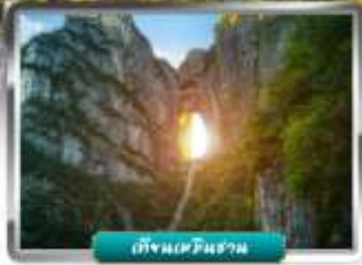
เทียนเวินชาน

เดินทางโดยสายการบินไทยเวียดเจ็ทแอร์ อาหาร : 10 มื้อ โรงแรม : 4 ดาว