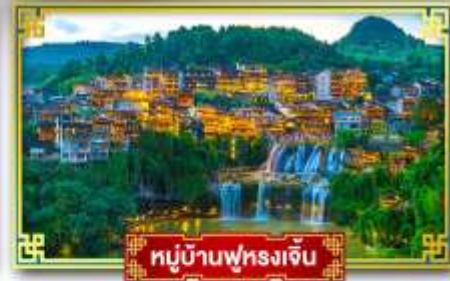
หมู่บ้านฟุรงเจิน