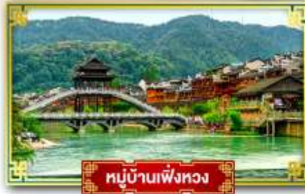
หมู่บ้านเฟิ่งหวง