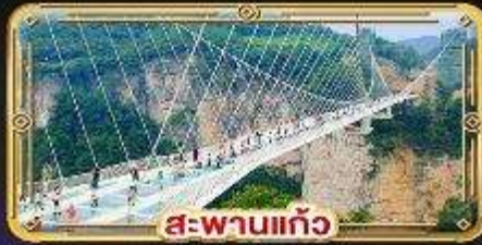
สะพานแก้ว