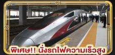
พิเศษ!! นิ่งรถไฟความเร็วสูง