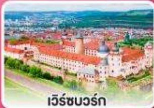
เวิร์ชบวร์ค