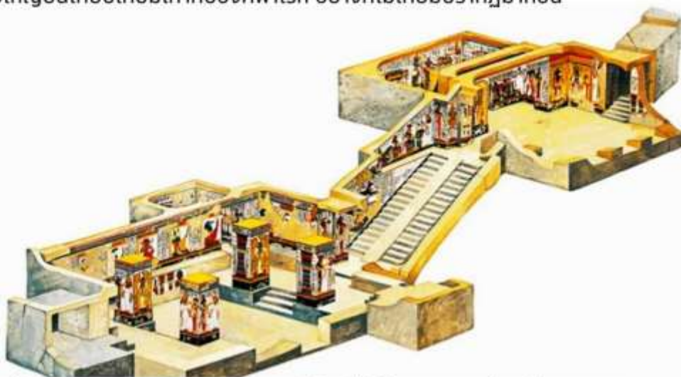
ผนังภายในสุสานของพระนางเนเฟอร์ตารีได้รับการตกแต่งอย่างสวยงาม