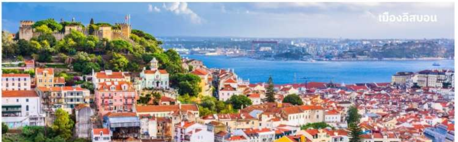
เมืองลิสบอน

นำท่านเข้าสู่ที่พัก Sana Metropolitan หรือเทียบเท่า