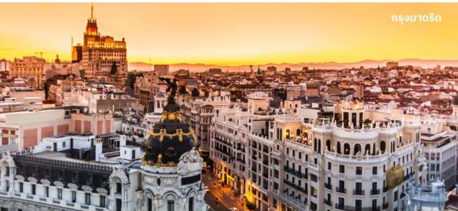
กรุงมาดริด

บริการอาหารกลางวัน ณ ภัตตาคาร จากนั้นนำเดินทางสู่ กรุงมาดริด เมืองหลวงของประเทศสเปน ใช้เวลาเดินทางประมาณ 5.30 ชั่วโมง ตั้งอยู่ใจกลางแหลมไอบีเรียน ในระดับความสูง 650 เมตร เป็นมหานครอันทันสมัยล้ำยุคที่กษัตริย์ฟิลลิปที่ 2 ได้ทรงย้ายที่ประทับจากเมืองโทเลโดมาที่นี่และประกาศให้มาดริดเป็นเมืองหลวงใหม่ ยกเว้นในช่วงประมาณปี ค.ศ. 1601-1607 เมื่อพระเจ้าฟิลลิปที่ 3 ได้ย้ายเมืองหลวงไปที่เมืองวัลลาโดลิด มาดริดได้ชื่อว่าเป็นเมืองหลวงที่สวยงามที่สุดแห่งหนึ่งในโลก และสูงสุดแห่งหนึ่งในยุโรป