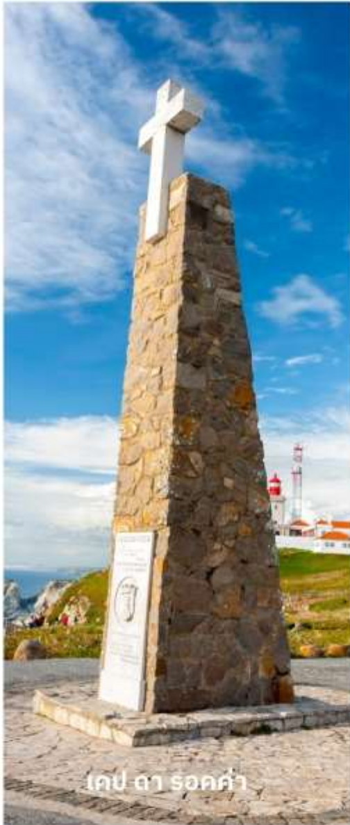
เคป ดา รอค่า

นำท่านชม เคป ดา รอค่า (Cabo da roca) อันเป็นแหลมที่ตั้งอยู่ปลายสุดทางทิศตะวันตกของทวีปยุโรป