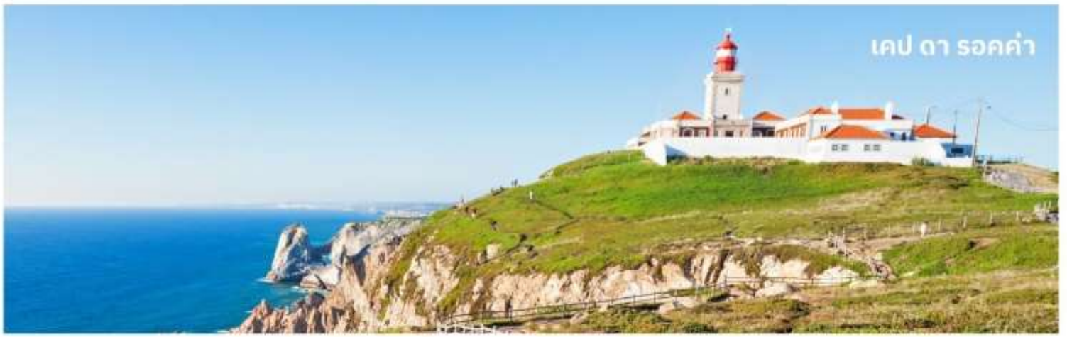
เคป ดา รอค่า