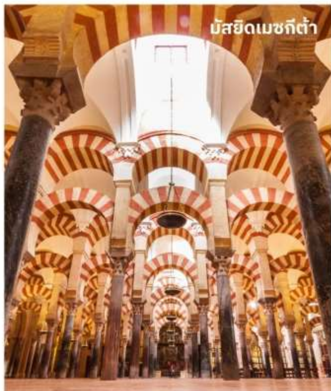
มัสยิดเมซquita

บริการอาหารเช้า ณ ห้องอาหารของโรงแรม หลังจากนั้นนำท่าน เข้าชมมัสยิดเมซquita ที่มีขนาดใหญ่โตและออกแบบอย่างวิจิตรด้วยการใช้เสาหินจำนวนมากถึง 850 ต้น ต่อยอดเสาด้วยโครงสร้างคานโค้งแบบศิลปะโรมัน ผสมกับลวดลายแบบมัวร์ช ประดับด้วยเครื่องกระเบื้องเคลือบ อิฐ และหินฉลุลาย กว้างทั้งอาคาร ด้านในสุดของมัสยิดจะสร้างมีหรับ อันเป็นเครื่องหมายแสดงทิศทางของเมืองเมกกะ ต่อมาเมื่อชาวคริสต์เข้ามายึดครองเมืองคอร์โดบา จึงได้มีการสร้างโบสถ์ขึ้นบริเวณกึ่งกลางของมัสยิด และสร้างหอระฆังสูง 93 เมตร ขึ้นในบริเวณสวนส้มและลานน้ำพุ