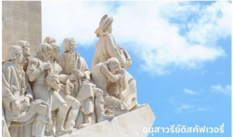
อนุสาวรีย์ดีสคัฟเวอรี