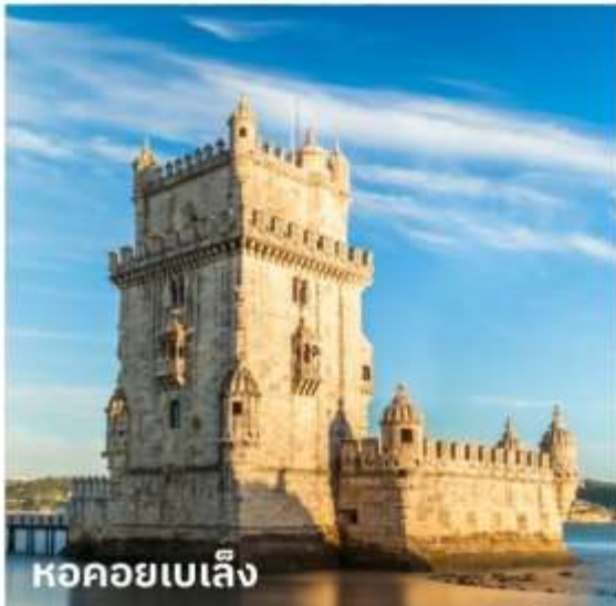
หอคอยเบเล็ง