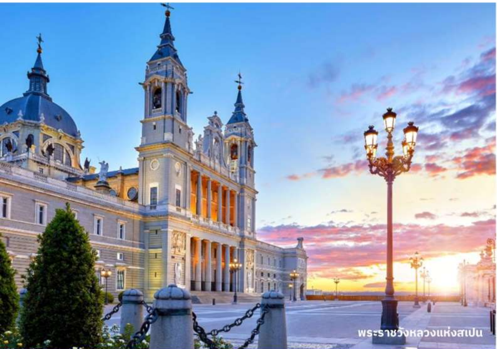
พระราชวังหลวงแห่งสเปน

จากนั้นนำท่านเข้าชม พระราชวังหลวงแห่งสเปน แห่งกษัตริย์ฮวน คาร์ลอส มีความสวยงามโอ้อ่า อลังการไม่แพ้พระราชวังอื่นๆ ในทวีปยุโรป เนื่องจากแนวความคิดเปรียบเทียบความใหญ่โตของพระ ราชวังแวร์ซายส์ และความสวยงามของพระราชวังลูฟว์ ในฝรั่งเศส ตั้งอยู่บนเนินเขาริมฝั่งแม่น้ำแมน ซานาเรส สร้างขึ้นในปี ค.ศ.1735 ใช้เวลาสร้างถึง 25 ปี ออกแบบโดยสถาปนิกชาวอิตาลีเลียน โดย การผสมผสานระหว่างศิลปะแบบฝรั่งเศสและอิตาลีประกอบด้วยห้องต่างๆ มากมายถึง 2,830 ห้อง (แต่เปิดให้เข้าชมเพียง12ห้อง) ซึ่งนอกจากจะมีการตกแต่งอย่างงดงามแล้ว ยังเป็นที่เก็บภาพ เขียนชิ้นสำคัญ ที่วาดโดยศิลปินในยุคนี้