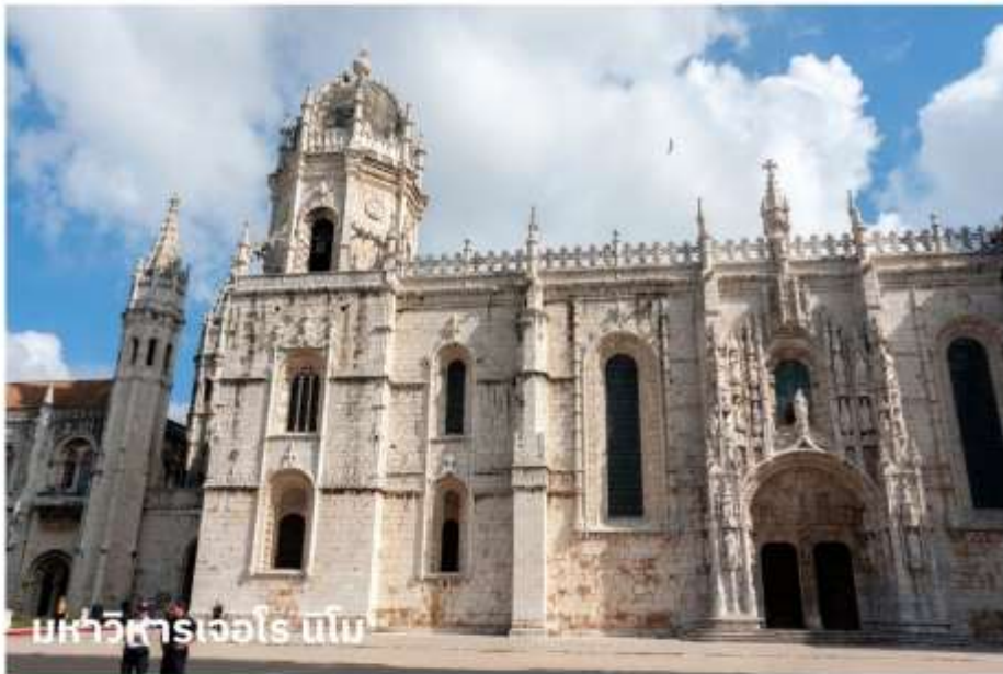
มหาวิหารเจโรนิโม

จากนั้นนำท่านบันทึกภาพกับ อนุสาวรีย์ดีสคัฟเวอรี สร้างขึ้นในปี ค.ศ. 1960 เพื่อฉลองการครบ 500 ปี แห่งการสิ้นพระชนม์ของ เจ้าชายเฮนรี่ เดอะเนวิเกเตอร์