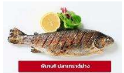
พิเศษ! ปลาเทราต์ย่าง

เกี๊ยง 🍷 รับประทานอาหารเช้า (มื้อที่6) เมบูพิเศษ ปลาเทราต์ย่างท่านละ 1 ตัว นำท่านเดินทางสู่ เมืองมรดกโลกเชสกี คุรมลอฟ (Cesky Krumlov) สาธารณรัฐเช็ก (ระยะทาง 210 กม./ 3.30 ชม.) ล้อมรอบด้วยแม่น้ำ Vltava ทำให้เมืองแห่งนี้มีลักษณะคล้ายหยดน้ำ จนถูกขนานนามว่าเป็น "เมืองหยดน้ำ" จากนั้นนำท่านถ่ายรูปบริเวณรอบนอก ปราสาทคุรมลอฟ (Cesky Krumlov Castle) เป็นปราสาทกอธิกดั้งเดิม ตั้งอยู่ริมฝั่ง