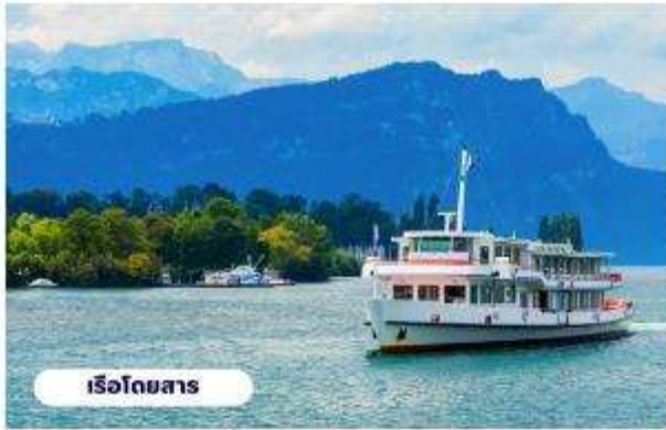
เรือโดยสาร