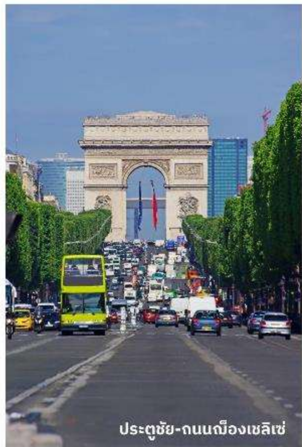
ประตูดัชชี่-ถนนฌ็องเซลิเซ่

บริการอาหารกลางวัน ณ ภัตตาคาร จากนั้นนำท่านเดินทางท่องเที่ยวตามสถานที่ ที่มีชื่อเสียงของกรุงปารีส