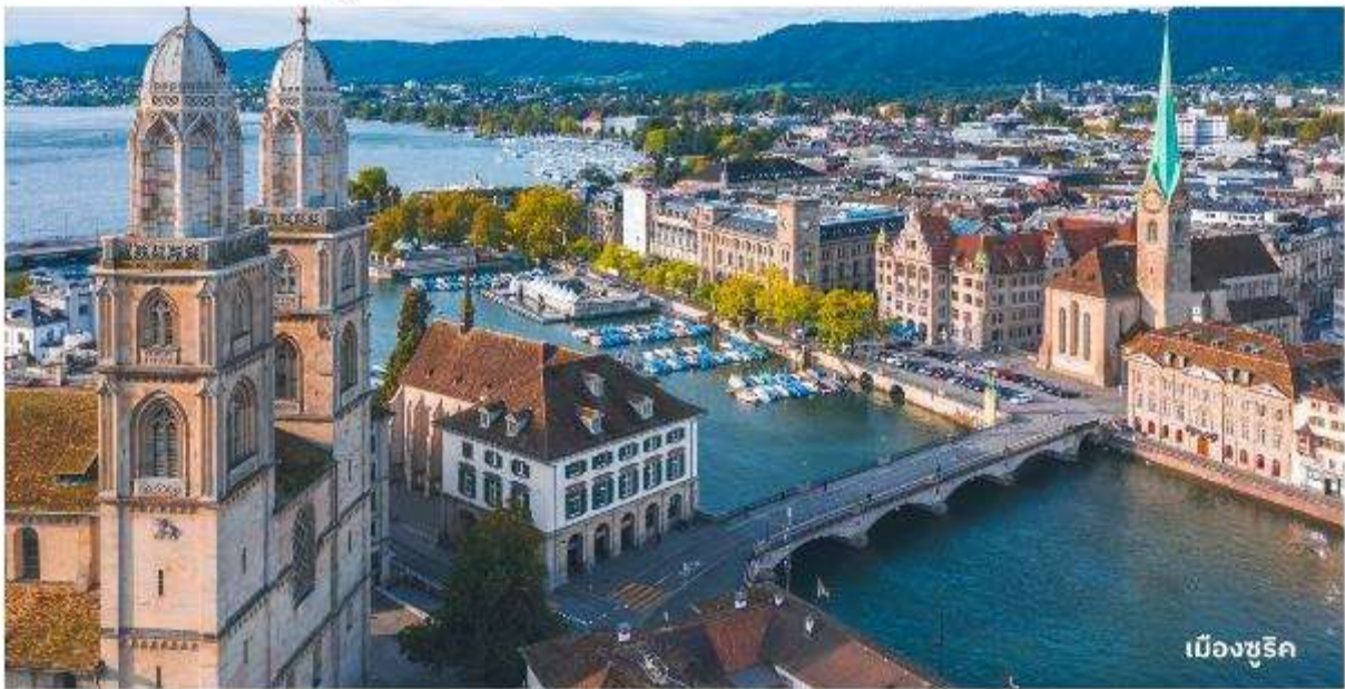
เมืองซูริก

จากนั้นนำท่านลงจากยอดเขาและเดินทางต่อไปยัง เมืองซูริก ใช้เวลาเดินทางประมาณ 1 ชั่วโมง นำท่านเที่ยวชม จัตุรัสพาราเดพลาทซ์ (Paradeplatz) จัตุรัสเก่าแก่ที่มีมาตั้งแต่สมัยศตวรรษที่ 17 ในอดีตเคยเป็นศูนย์กลางของการค้าสัตว์ที่สำคัญของเมืองซูริก ปัจจุบันจัตุรัสนี้ได้กลายเป็นชุมทางรถไฟที่สำคัญของเมืองและยังเป็นศูนย์กลางการค้าของย่านธุรกิจ ธนาคาร สถาบันการเงินที่ใหญ่ที่สุดในประเทศสวิตเซอร์แลนด์ นำท่านแวะถ่ายรูปกับ โบสถ์ฟรอมมุนสเตอร์ (Fraumunster Abbey) จากบนสะพานมุนสเตอร์บรูค เป็นโบสถ์ที่มีชื่อเสียงของเมืองซูริก สร้างขึ้นในปี ค.ศ. 853 โดยกษัตริย์เยอรมันหลุยส์ ใช้เป็นสำนักแม่ชีที่มีกลุ่มหญิงสาวชนชั้นสูงจากทางตอนใต้ของเยอรมันอาศัยอยู่ นำท่านสู่ ถนนบาห์นโฮฟชตราสเซอร์ (Bahnhofstrasse) เป็นถนนอันลือชื่อที่มีความยาวประมาณ 1.4 กิโลเมตร เป็นถนนที่เป็นที่รู้จักในระดับนานาชาติ ว่าเป็นถนนช้อปปิ้งที่มีสินค้าราคาแพงที่สุดแห่งหนึ่งของโลก ตลอดสองข้างทางล้วนแล้วแต่เป็นที่ตั้งของห้างสรรพสินค้า ร้านค้าอัญมณี ร้านเครื่องประดับ ร้านนวดสปาและโรงแรมระดับหรู อิสระให้ท่านเดินเล่นและเลือกซื้อสินค้าตามอัธยาศัย ได้เวลาอันสมควรนำท่านสู่สนามบิน