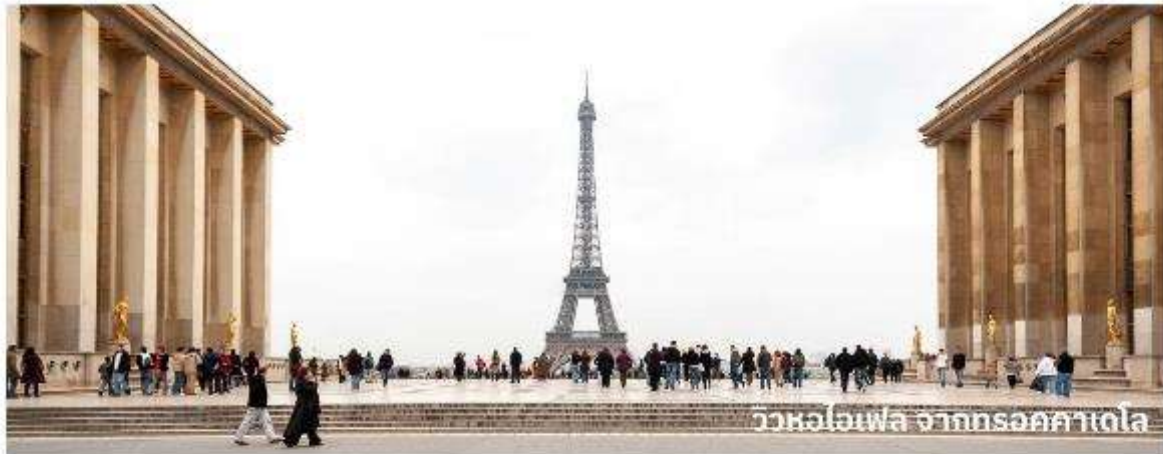
วิวหอไอเฟล จากทรอคคาเดอโล

จากนั้นนำเดินทางสู่ พิพิธภัณฑ์ลูฟร์ ให้ท่านได้ถ่ายรูปด้านหน้าพีระมิดแก้วของพิพิธภัณฑ์ลูฟร์ เป็นพิพิธภัณฑ์ทางศิลปะที่มีชื่อเสียงที่สุด เท่าที่ที่สุดและใหญ่ที่สุดแห่งหนึ่งของโลก จากนั้นนำท่าน ล่องเรือมาโตมุช (Bateaux Mouches River Cruise) เรือล่องไปตามแม่น้ำแซน ที่ไหลผ่านใจกลางกรุงปารีส ชมความสวยงามของสถาปัตยกรรมอันคลาสสิกของอาคารต่างๆ จากนั้นนำท่านสู่ Samaritaine ห้างสรรพสินค้าใจกลางเมืองปารีส เปิดให้บริการมาแล้วกว่า150ปี และได้มีการปรับปรุงใหม่ แล้วเสร็จเมื่อปี 2021 ภายในห้างจะมี สินค้าแบรนด์เนมมากมายให้ท่านได้เลือกซื้อมากมาย