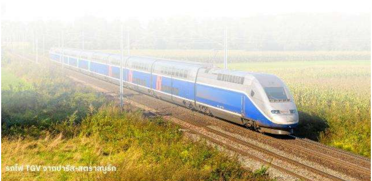
รถไฟ TGV จากปารีส-สตราสบูร์ก

สตราสบูร์กเป็นเมืองใหญ่มีสถาปัตยกรรมสมัยโบราณเป็นร่องรอยประวัติศาสตร์ให้ชาวเมืองปัจจุบันได้ชื่นชม