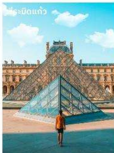
พีระมิดแก้ว