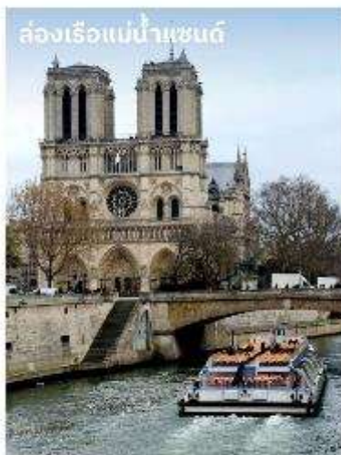
ล่องเรือแม่น้ำแซนดี

จากนั้นนำเดินทางสู่ พิพิธภัณฑ์ลูฟร์ ให้ท่านได้ถ่ายรูปด้านหน้าพีระมิดแก้วของพิพิธภัณฑ์ลูฟร์ เป็นพิพิธภัณฑ์ทางศิลปะที่มีชื่อเสียงที่สุด เท่าที่ที่สุดและใหญ่ที่สุดแห่งหนึ่งของโลก จากนั้นนำท่าน ล่องเรือมาโตมุช (Bateaux Mouches River Cruise) เรือล่องไปตามแม่น้ำแซน ที่ไหลผ่านใจกลางกรุงปารีส ชมความสวยงามของสถาปัตยกรรมอันคลาสสิกของอาคารต่างๆ จากนั้นนำท่านสู่ Samaritaine ห้างสรรพสินค้าใจกลางเมืองปารีส เปิดให้บริการมาแล้วกว่า150ปี และได้มีการปรับปรุงใหม่ แล้วเสร็จเมื่อปี 2021 ภายในห้างจะมี สินค้าแบรนด์เนมมากมายให้ท่านได้เลือกซื้อมากมาย