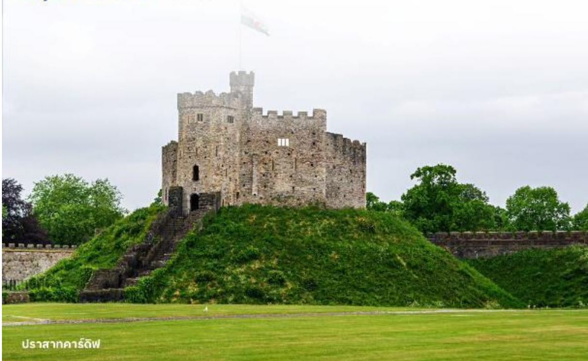
ปราสาทคาร์ดิฟฟ์

บริการอาหารค่ำ ณ ภัตตาคาร นำท่านเข้าสู่ที่พัก Clayton Hotel Cardiff หรือเทียบเท่า