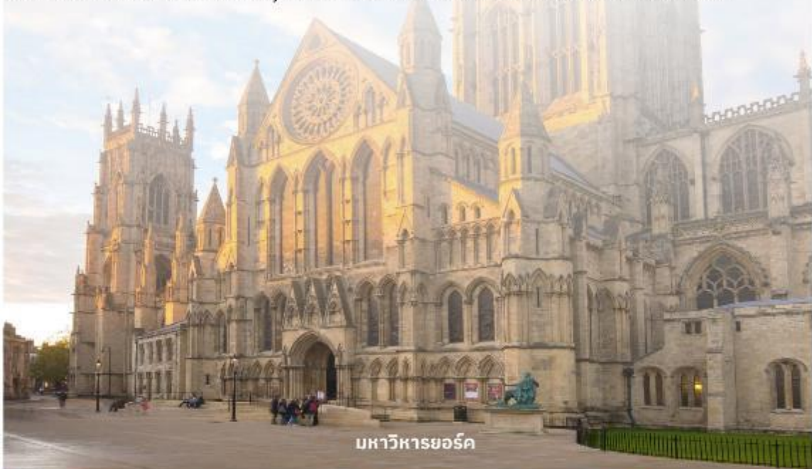
มหาวิหารยอร์ก

จากนั้นนำท่านเดินต่อไปที่ The Shambles (เดอะแซมเบิล) เป็นสถานที่ที่มีความคล้ายกับตรอกไดอากอนในภาพยนตร์ชื่อดังอย่าง Harry Potter อีสระให้ท่านเดินเลือกซื้อของที่ระลึกตามอัธยาศัย