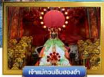
เจ้าแม่กวนอิมสองห้า