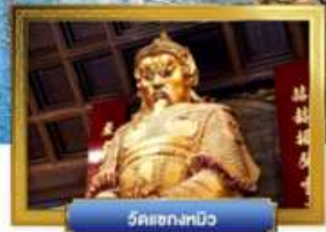
วัดเข่งทิว