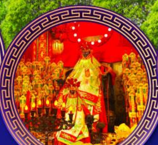
วัดเจ้าแม่กวนอิม ย่องฮ่า