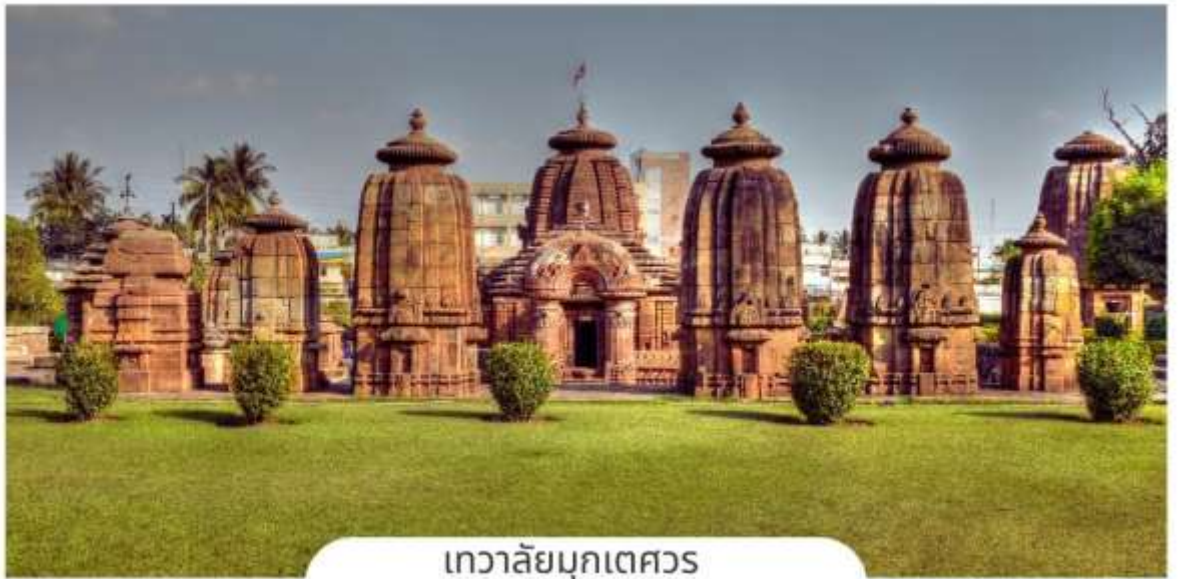
เทวาลัยมุกเตศวร (Mukteshwara Temple)