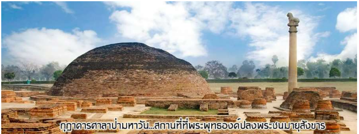
กุฎาคารศาลาป่ามหารวัน...สถานที่ที่พระพุทธองค์ปลงพระชนมายุสังขาร

นำท่านเดินทางต่อสู่เมือง กุสินารา (เดินทางประมาณ 4 ชั่วโมง)เมื่อถึงกุสินาราแล้วเดินทางไป วัดไทยกุสินาราเฉลิมราชย์ วัดนี้สร้างขึ้นเพื่อน้อมเป็นพุทธบูชาและเฉลิมพระเกียรติพระบาทสมเด็จพระเจ้าอยู่หัวในวาระครองสิริราชสมบัติครบ 50 ปี และเฉลิมพระชนมพรรษาครบ 6 รอบ 72 พรรษา พระบาทสมเด็จพระเจ้าอยู่หัวพระราชทานชื่อวัดให้ เชิญท่านร่วมทำบุญตามกำลังศรัทธา