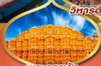
วิหารอักชาร์ตัม