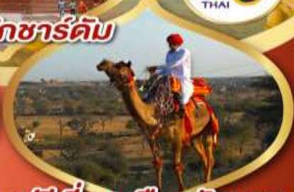
ฟรี ژیู่ซู เมืองมันทอวา ราคาเริ่มต้น