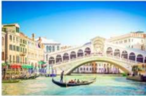
สะพานริอัลโต