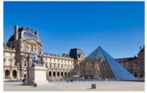
พิพิธภัณฑ์ลูฟร์

หลังจากนั้นนำท่านเดินทางสู่ La Vallee Village Outlet