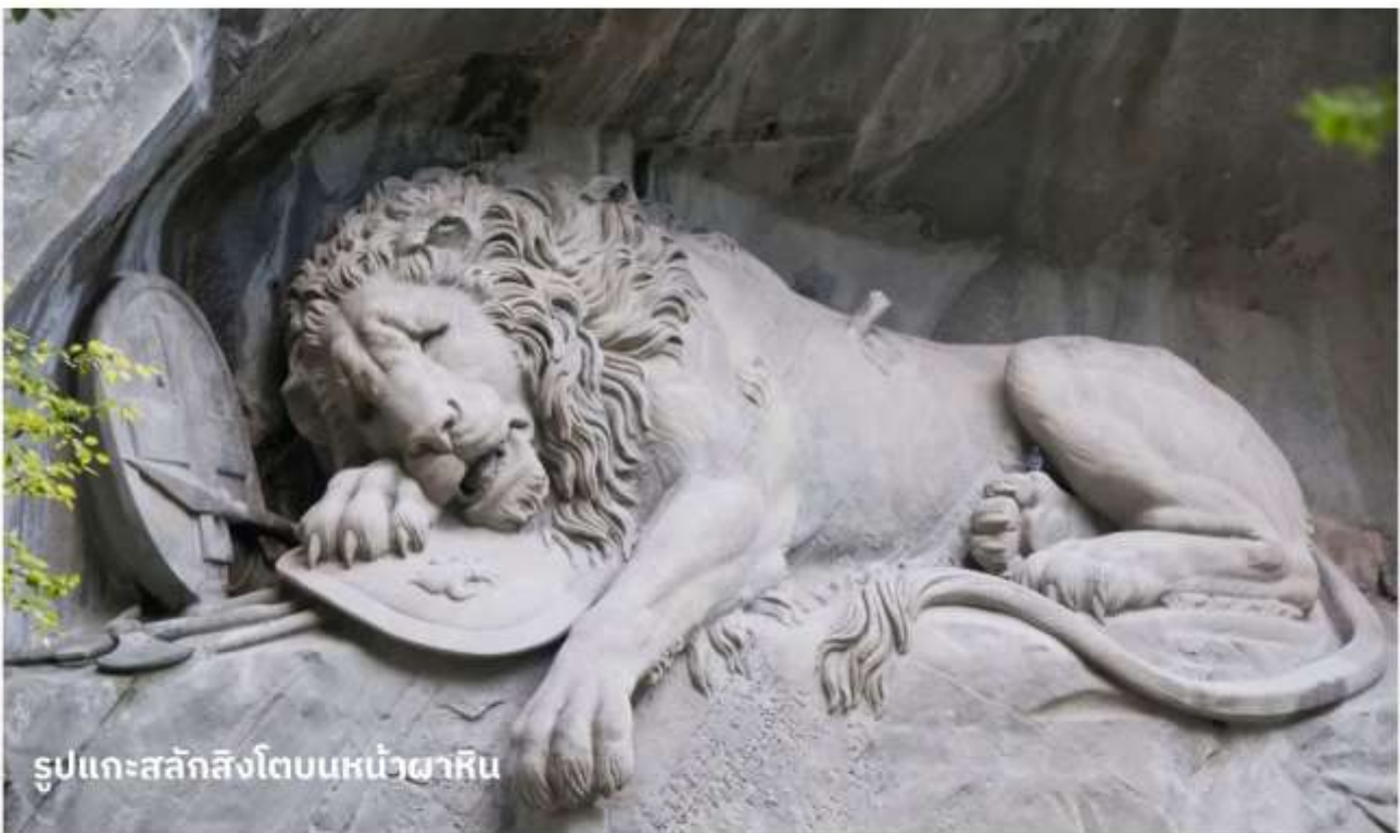
รูปแกะสลักสิงโตบนหน้าผาหิน

จากนั้นนำท่านชมและแวะถ่ายรูปกับ สะพานไม้ชาเปล หรือสะพานวิหาร (Chapel bridge) ซึ่งข้ามแม่น้ำรอยซ์ เป็นสะพานไม้ที่เก่าแก่ที่สุดในโลก มีอายุหลายร้อยปี เป็นสัญลักษณ์และประวัติศาสตร์ของเมืองลูเซิร์นเลยทีเดียว จากนั้นนำท่านเที่ยวชม รูปแกะสลักสิงโตบนหน้าผาหิน เป็นอนุสาวรีย์ที่ตั้งอยู่ใจกลางเมืองที่หัวของสิงโตจะมีโล่ห์ ซึ่งมีกากบาทสัญลักษณ์ของสวิตเซอร์แลนด์ อยู่ อนุสาวรีย์รูปสิงโตแห่งนี้ออกแบบและแกะสลักโดย ธอร์ วอลเสน ใช้เวลาแกะสลักอยู่ราว 2 ปี โดยสร้างขึ้นเพื่อเป็นเกียรติแก่ทหารสวิส ในด้านความกล้าหาญ ซื่อสัตย์ จงรักภักดี ที่เสียชีวิตในประเทศฝรั่งเศส ระหว่างการต่อสู้ป้องกันพระราชวังในครั้งปฏิวัติใหญ่สมัยพระเจ้าหลุยส์ที่ 16