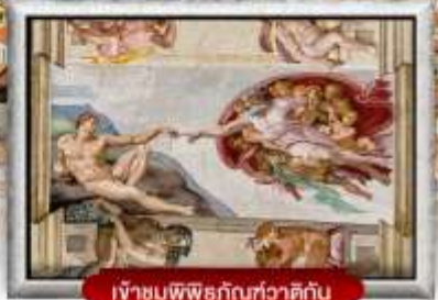
เข้าชมพิพิธภัณฑ์วาติกัน

เมนูพิเศษ! สปาเกตตี้เส้นหมึกดำ, พิชซ่าสไตล์อิตาลีเย็นแท้