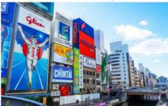
รับประทานอาหารค่ำ ณ กิตตาคาร..พิเศษ!!! อิ่มอร่อยขีดเบิ๊งย่างเนื้อวัวมัดสิซากะ- หอนุ่ม ละ-นุบลิ้น