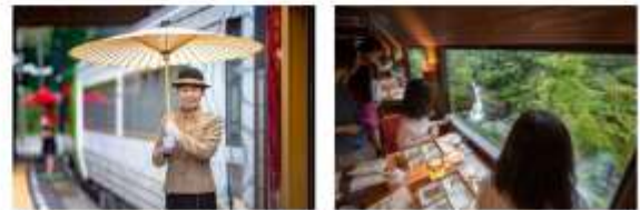
พิเศษ รับประทานอาหารกลางวันบนรถไฟ กับวิวธรรมชาติหลักล้าน

(รูปภายในรถไฟอาจมีการเปลี่ยนแปลง โดยไม่จำเป็นต้องแจ้งให้ทราบล่วงหน้า)