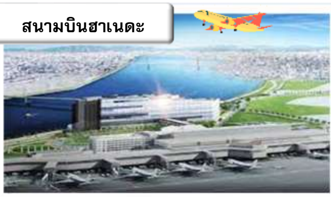
สนามบินฮานอย

22.45 น. ออกเดินทางสู่ สนามบินฮานอย ประเทศญี่ปุ่น โดย สายการบินไทย เที่ยวบินที่ TG 644