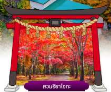
สวนฮิราโอะ