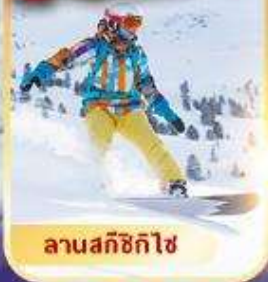
ลานสกีซิกิไซ