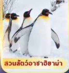
สวนสัตว์อาซาฮิยาม่า