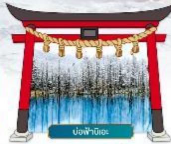
บ่อฟ้านิเอะ

✓ ชมความสวยงามท่ามกลางหิมะ ณ หมู่บ้านเทพนิยาย นิงเกิลเกอเรซ