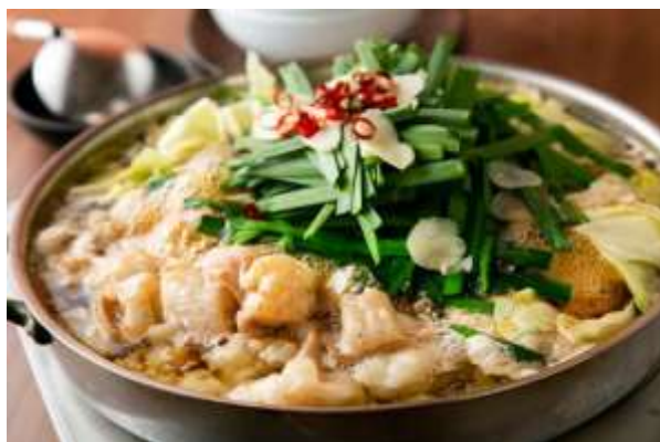
มตสึนาเบะ (Motsunabe)