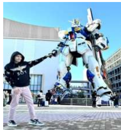
หุ่นกันดั้ม ชื่อ RX93 FF Nu Gundam

เดินทางต่อไปยัง ร้านค้า DUTY FREE ให้ท่านได้ซื้อป๊อปปิ้งสินค้าปลอดภาษีที่มีคุณภาพ อาทิ เครื่องสำอาง โฟมล้างหน้า(แนะนำ) อาหารเสริม ขนม เครื่องใช้ต่างๆ ฯลฯ ...จากนั้นแวะ แซะรูปกับหุ่นกันดั้มยักษ์ ณ ห้าง LaLaport (หากมีเวลาพอ) มีขนาดใหญ่กว่า Unicorn Gundam ที่โตเกียวและใหญ่กว่า RX93 FF Gundam ที่ Gundam Factory Yokohama เรียกได้ว่าเป็นแลนด์มาร์คสำคัญของเมืองฟูกูโอกะในปัจจุบัน ...จากนั้นอิสระให้ท่านซื้อป๊อปปิ้ง ย่านเทนจิน (Tenjin) หรือ ย่านฮากาตะ (Hakata) เป็นย่านช้อปปิ้งขนาดใหญ่ใจกลางเมือง รวบรวมแหล่งบันเทิง อย่างครบครัน ไม่ว่าจะเป็นตึกต้นไม้ ร้านค้าที่น่าสนใจ และบรรยากาศสุดคลาสสิก หรือจะเป็นย่านของกินอร่อยๆ อย่างย่านยะไต (Yatai) หมายถึง ชุมชขายอาหารที่มีขนาดเล็กไม่ใหญ่มาก ที่รวมร้านอาหารแบบฉบับท้องถิ่นเอาไว้มากมาย