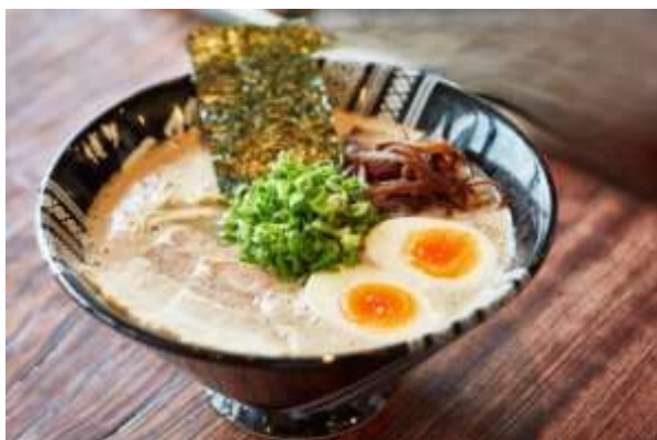
ฮากาตะราเมง (Hakata Ramen)