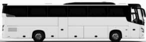
ตัวอย่างรถทัวร์ 1 ชั้น

ค่าที่พักตามที่ระบุในรายการหรือเทียบเท่าระดับเดียวกัน (พักห้องละ 2 ท่าน) หากประเภทห้องที่ท่านริเวควมาเดิม อาทิ เช่น 5 เควสห้องพักเป็น TWIN BED หรือ DOUBLE BED ทางบริษัทขอสงวนสิทธิ์ในการปรับประเภทห้องพัก เป็นตามที่โรงแรมมีอยู่ โดยไม่ต้องแจ้งให้ทราบล่วงหน้า