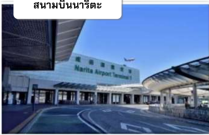
สนามบินนาริตะ

เวลา 02.30 น. ออกเดินทางสู่ สนามบินนาริตะ ประเทศญี่ปุ่น โดย สายการบินไทยแอร์เอเชียเอ็กซ์ เที่ยวบินที่ XJ 602