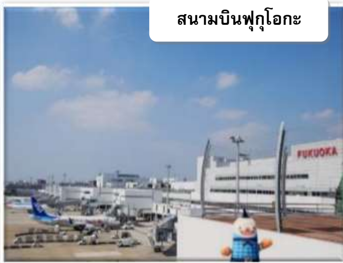
สนามบินฟุกุโอกะ

บริการอาหารร้อนบนเครื่องพร้อมกับเมนูผลไม้สดเพื่อเติมเต็มความพิเศษไปพร้อมกับความสดชื่น