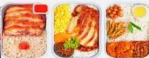
บริการอาหารร้อน ทั้งขาไป-ขากลับ