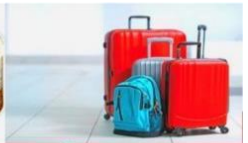
น้ำหนักกระเป๋า สูงสุด 20 กก.