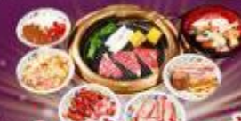
บุฟเฟต์ ปังย่าง 1 มื้อ

ราคา เดี่ยว 45,919 บาท รวมภาษีมูลค่าเพิ่ม 7%