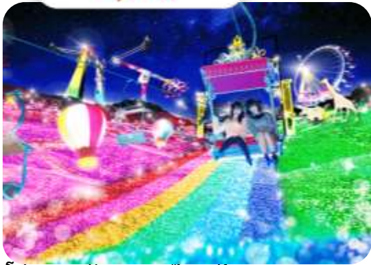
โปรแกรมเดินทาง 5 วัน 4 คืน AIR ASIA X

โตเกียว นาริตะ ฟุจิ อิบารากิ นิกโก้ ลานสกีฟูจิเกิน