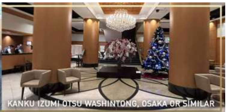
KANKU IZUMI OTSU WASHINTONG, OSAKA OR SIMILAR

วันที่ 5 สนามบินคันไซ – กรุงเทพ (ดอนเมือง)